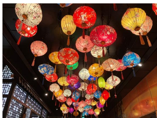
それぞれ色柄が異なる、色鮮やかな提灯