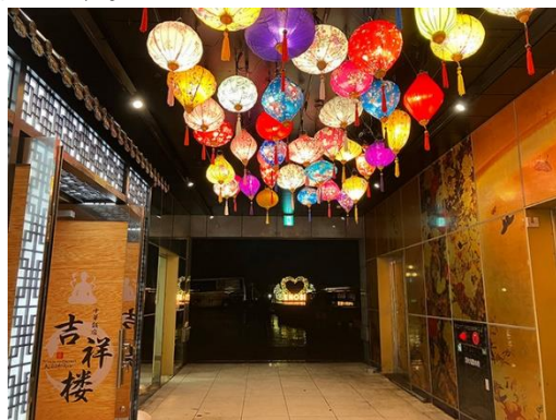
ライトアップされた中国提灯がお出迎え

中国提灯、ハートのオブジェとともに自由に出入りできる箇所にあるので、どなたでも撮影をお楽しみになれます。