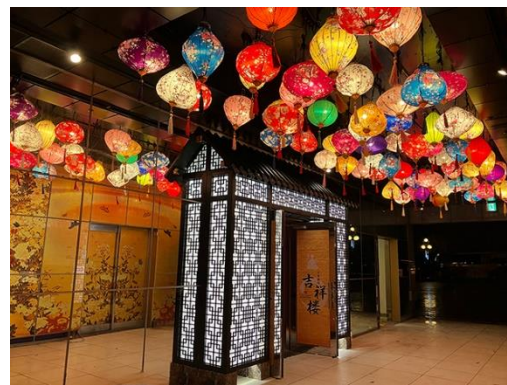
撮影の際は鏡に映る提灯を取めるのがポイント