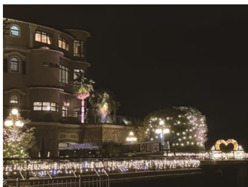
江の島入口をライトアップ

関東三大イルミネーションにも認定される「湘南の宝石」は数あるイルミネーションの中でも、施設単体で行うイルミネーションとは異なり、江の島全体で行われる冬の一大イベントとして多くの観光客から支持され続けています。毎年、メイン会場「サムエルコッキング苑」の来苑者も増加傾向にあり、昨年実績は20万人、本年は22万人を見込んでいます。湘南・江の島の地域一体となった取り組みに当館も積極的に参画。江の島の入口をイルミネーションで彩り、訪れるみなさまをお迎えします。特に2021年に登場した「ハートのオブジェ」は昼夜問わず江の島の新・撮影スポットとして親しまれています。