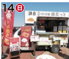
14日 鎌倉 Dining 由比っど (ナポリタン焼きそば)