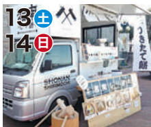
13土 14日 湘南しり餅