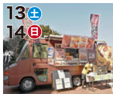
13土 14日 frees (串焼き・ホットドッグ)