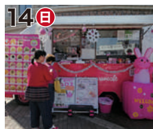
14日 ルンルン 湘南 RUNRUN CAFÉ (クレープ)