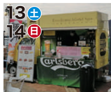
13土 14日 吉祥ラーメン