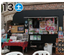
13土 SEVEN COLORS FOOD TRUCK (クレープ)