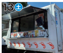
13土 アフアフ Ahuahu (ガーリックシュリンプ)